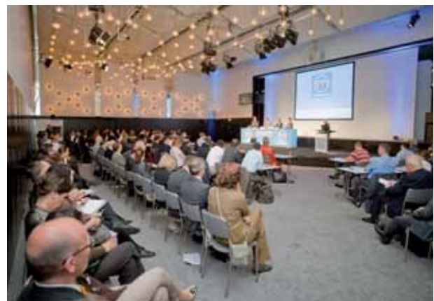
Blick aus dem Zuschauerraum auf der PerMediCon *

Am 21. und 22. Juni 2011 öffnete die PerMediCon bereits zum zweiten Mal ihre Tore in Köln. Kongressteilnehmer und Aussteller der europaweit einzigartigen Veranstaltung zum Thema Personalisierte Medizin erlebten zwei intensive und effiziente Kongress- und Messetage mit namhaften internationalen Referenten und einem informativen Ausstellungsbereich. Der ganzheitliche Ansatz des Kongresskonzeptes lockte rund 400 teilnehmende Experten und über 30 ausstellende Unternehmen auf das Kölner Messegelände.