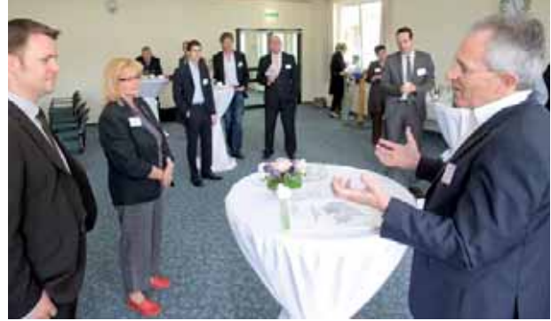
Get together *