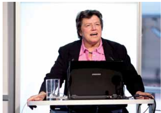
Marlis Bredehorst, Staatssekretärin im Ministerium für Gesundheit, Emanzipation, Pflege und Alter des Landes NRW (MGEPA)

ihre Produkte und Dienstleistungen ausgestellt haben. 56 Ausstellerinnen und Ausstellern aus Nordrhein-Westfalen haben sich am NRW-Gemeinschaftsstand auf einer Ausstellungsfläche von über 500 Quadratmetern beteiligt. 26 Ausstellerinnen und Aussteller waren auf der Fläche des MGEPA präsent. Die NRW Gesundheitsregionen haben sich gemeinsam mit zahlreichen Mitgliedsunternehmen an sechs definierten Thementheken dargestellt: