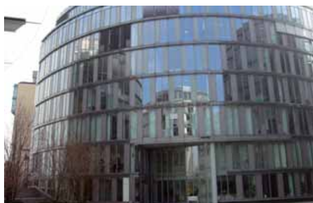
Eingang des Mediapark zu den Geschäftsräumen der Gesundheitsregion KölnBonn e.V.

In den Sommermonaten des Jahres 2011 bezog die Geschäftsstelle des Gesundheitsregion KölnBonn e.V. neue Räumlichkeiten im MediaPark 4d (EG 2) in Köln. Die dortigen Geschäftsräume werden in einer Bürogemeinschaft mit dem gewi – Institut für Gesundheitswirtschaft e.V. sowie der INNOBROKER GmbH genutzt. Neben einer ausreichenden Anzahl an Arbeitsräumen und einem Konferenzraum besteht eine räumliche Kooperation mit der Hochschule Fresenius Köln, der das gewi – Institut für Gesundheitswirtschaft als An-Institut angehört.