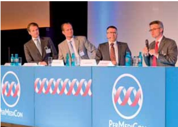
Podiumsdiskussion: Unternehmensstrategie personalisierte Medizin *