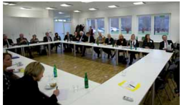
Das Plenum *

ein fundiertes Vorgehen, das frühzeitig alle Aspekte einbezieht und somit Planungs- und Kostensicherheit für den Auftraggeber bedeutet.