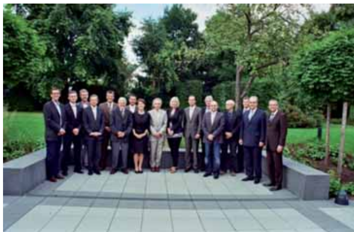
Der Erweiterte Vorstand bei seiner Sitzung beim BAH in Bonn.

Die erste dreijährige Amtszeit des Vorstandes endet Mitte 2012, so dass in der nächsten Mitgliederversammlung satzungsmäßige Neuwahlen vorzunehmen sind.