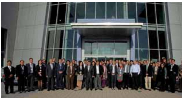
Teilnehmer der Temos Conference

Die 3. Internationale Temos Conference fand vom 20. bis zum 22. November 2011 im Mercedes-Benz Center in Köln statt. Der Fokus dieser Konferenzmesse liegt auf dem nationalen und internationalen Medizintourismus und der Reisemedizin. In Fachvorträgen und Workshops zu Themen wie „Medizintourismus: Die Rolle des Case Managements & der nicht-medizinischen Leistungen“ sowie „Medizintourismus: Spitzenmedizin & Zukunftsthemen“ tauschten sich rund 120 Experten aus den unterschiedlichsten Bereichen der überregionalen und internationalen Gesundheitswirtschaft aus. Ziel der Konferenz ist es, die Repräsentanten von Krankenhäusern, Krankenversicherungen, Patienten, Reiseveranstaltern, Patienten-Vermittlern und Rechtsexperten zusammenzuführen, um bestehende Hindernisse zu diskutieren und mögliche Lösungen für den Medizintourismus zu erarbeiten. Zwischen den Fachvorträgen besuchten die Teilnehmer die begleitende Ausstellung, auf der auch der Gesundheitsregion KölnBonn e.V. vertreten war.