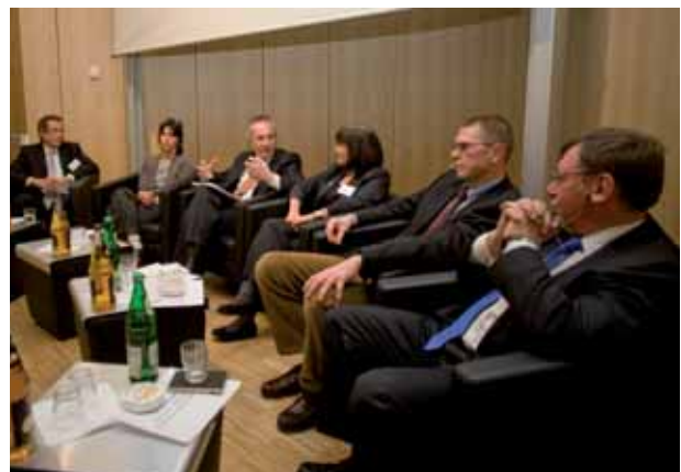
Die Podiumsdiskussion *