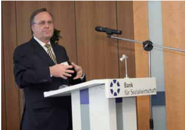
Landrat Werner Stump