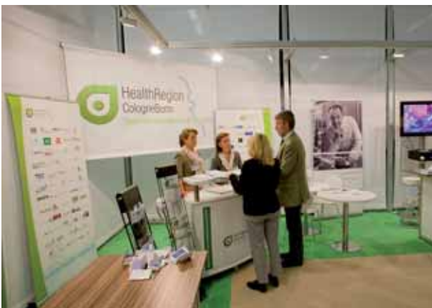
Messestand der Gesundheitsregion KölnBonn e.V. *