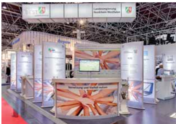
Gemeinschaftsstand des Landes NRW

Die Gesundheitswirtschaft Nordrhein-Westfalen hat sich an einem Gemeinschaftsstand des Ministeriums für Wirtschaft, Energie, Bauen, Wohnen und Verkehr des Landes NRW, des Ministeriums für Innovation, Wissenschaft und Forschung des Landes NRW sowie des Ministeriums für Gesundheit, Emanzipation, Pflege und Alter des Landes NRW gut und vielfältig präsentiert: Insgesamt waren auf der MEDICA ca. 300 Unternehmen aus Nordrhein-Westfalen vertreten, die in verschiedenen Hallen themenspezifisch