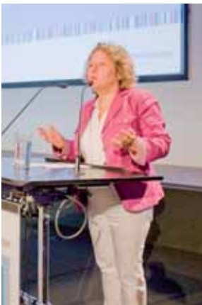
Svenja Schulze, Ministerin für Innovation, Wissenschaft und Forschung des Landes NRW *

Personalisierte Medizin ist der Überbegriff für eine Strategie, die darauf abzielt, Medikamente und Therapien zu entwickeln, die auf den einzelnen Patienten zugeschnitten sind. Dabei sollen routinemäßige Gentests helfen, medizinische Behandlungen möglichst individuell an das genetische Profil des einzelnen Patienten anzupassen: Optimale Wirksamkeit, bei minimalen Nebenwirkungen sind das erklärte Ziel. Vor diesem Hintergrund diskutierten Vertreter aus Wissenschaft, Industrie und Ärzteschaft, Verantwortliche aus Behörden, Politik, Patientenorganisationen sowie Investoren zwei Tage lang in Köln über aktuelle Fragestellungen in der Personalisierten Medizin, entwickelten Strategien und Lösungsansätze. Durch diesen ganzheitlichen Ansatz will die PerMediCon Impulse und zugleich mehr Transparenz in das Thema der Personalisierten Medizin bringen.